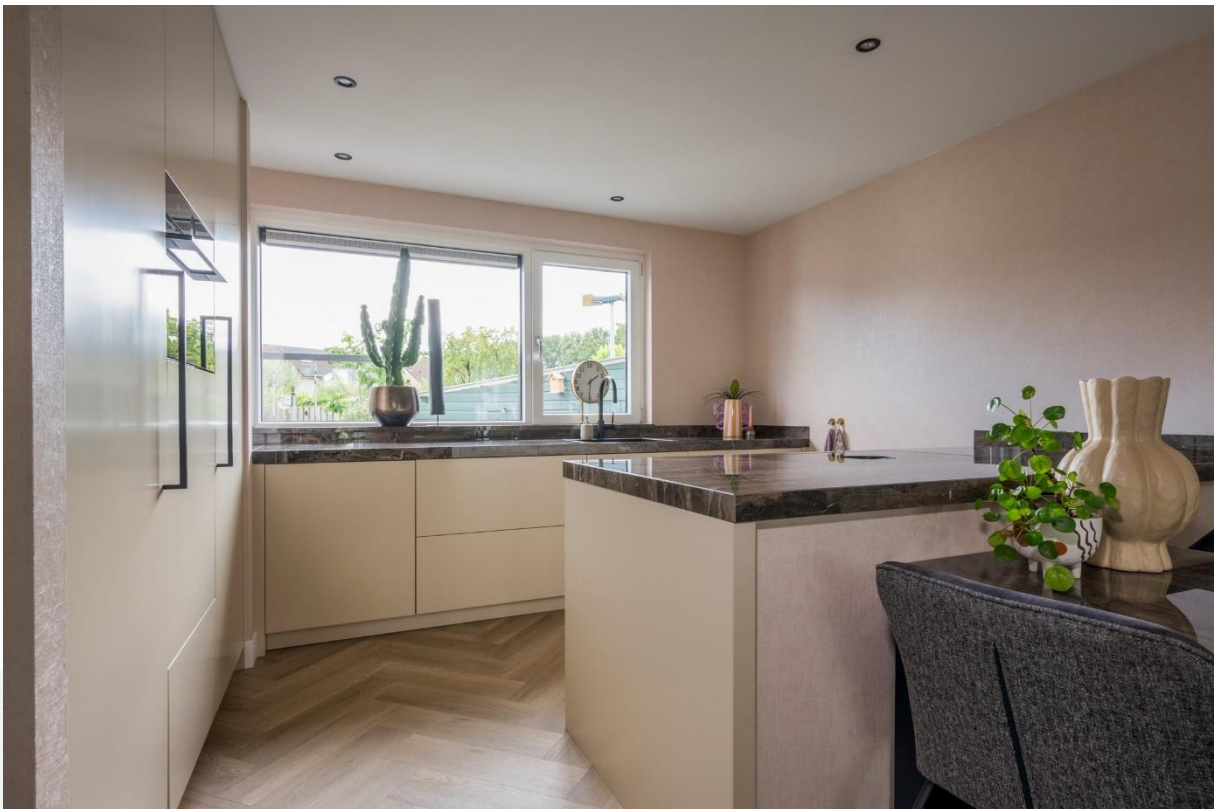
Open keuken gesitueerd aan de achterzijde